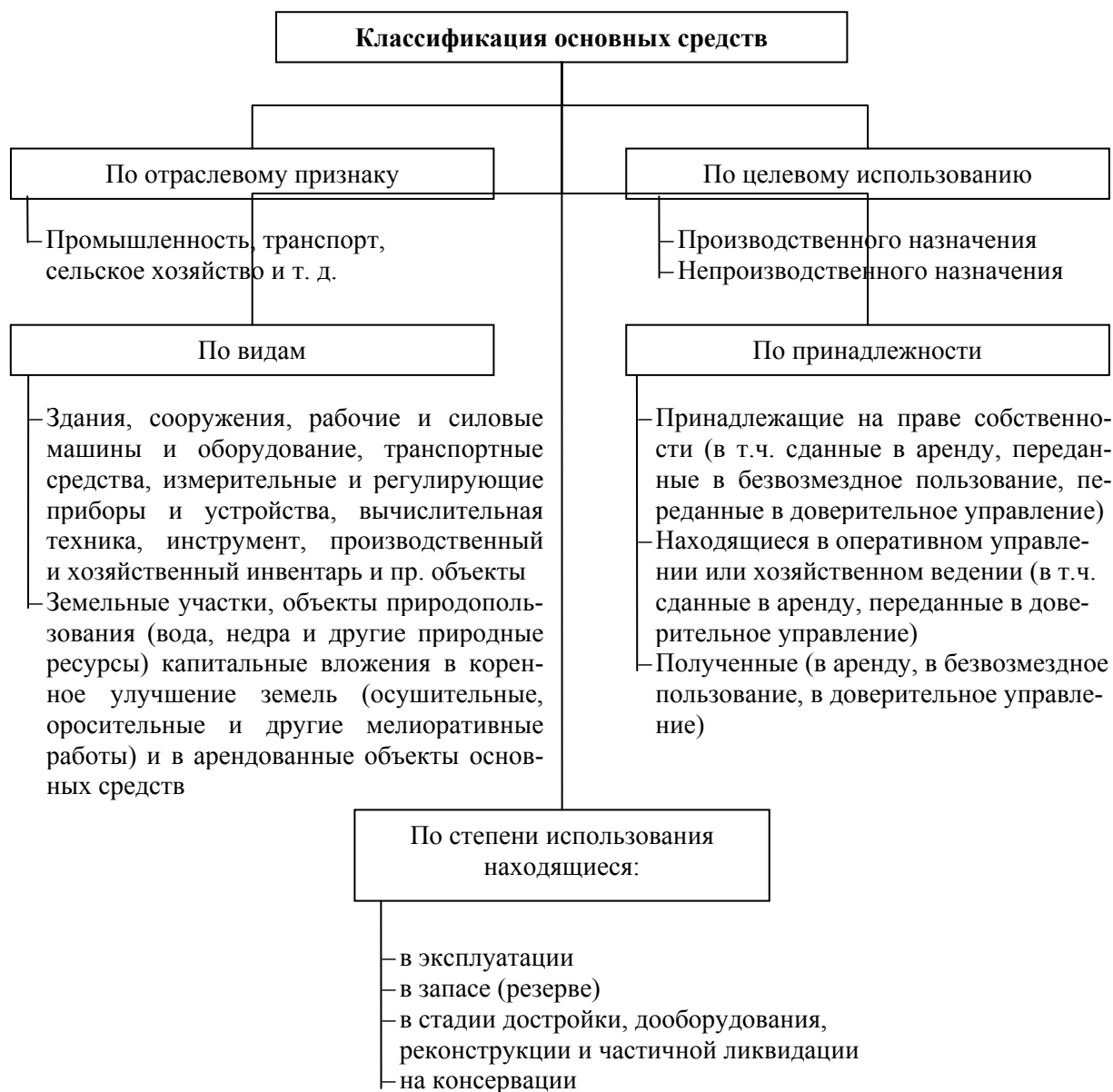
Рис. 4. Классификация основных средств по различным признакам

Основные средства классифицируются по ряду признаков: по видам, назначению и характеру участия в процессе производства, степени использования и по принадлежности, по отраслевому признаку (рис. 4).