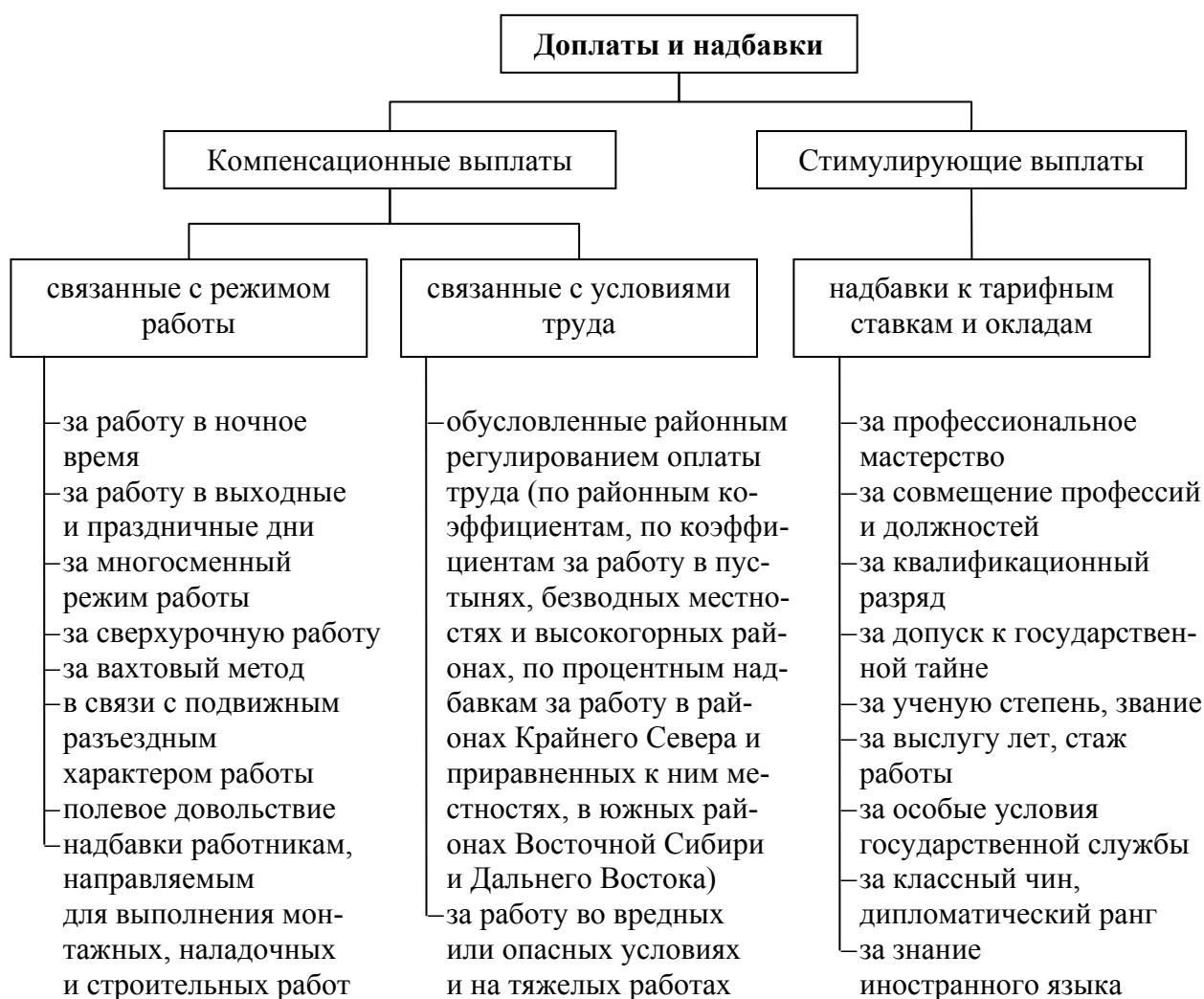
Рис. 2. Виды доплат и надбавок

При выполнении работ в условиях труда, отклоняющихся от нормальных, работнику производятся соответствующие доплаты, предусмотренные коллективным или трудовым договором. При этом размеры доплат не могут быть ниже установленных законами и иными нормативными правовыми актами.