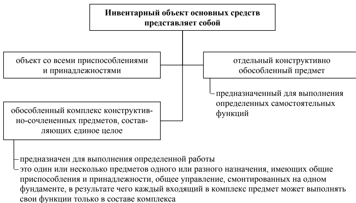
Рис. 5. Понятие и виды инвентарных объектов

Для организации учета и обеспечения контроля сохранности основных средств каждому объекту основных средств (инвентарному объекту) независимо от того, находится ли он в эксплуатации, в запасе или на консервации, присваивается при принятии его к бухгалтерскому учету соответствующий инвентарный номер .