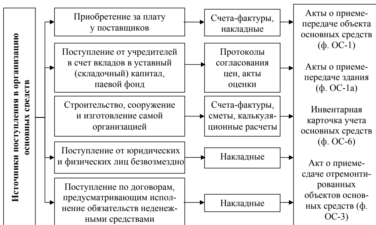
Рис. 6. Источники и способы поступления основных средств

Основные средства могут поступать в организацию различными способами (рис. 6).