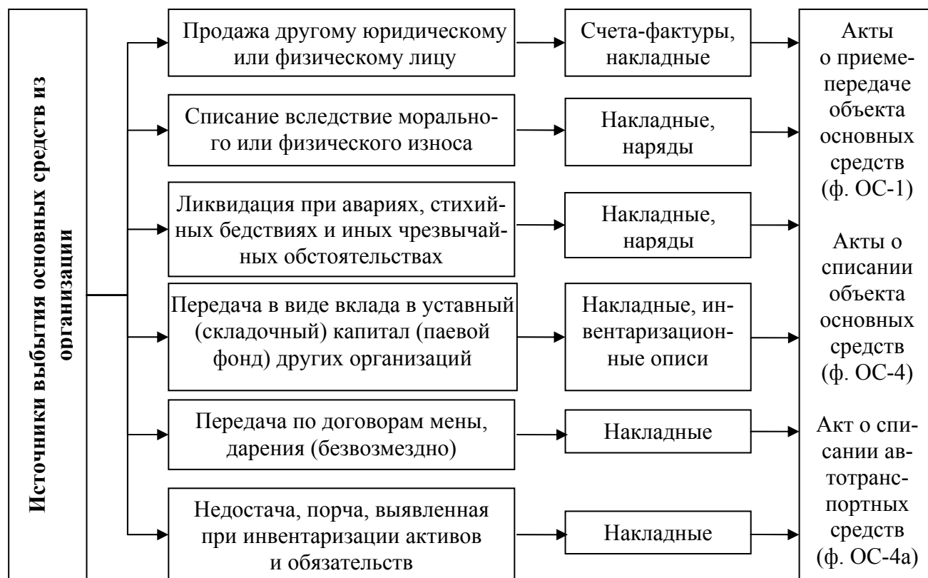
Рис. 7. Направления и способы выбытия объектов основных средств

Выбывать основные средства могут по следующим направлениям: продажа, передача в качестве вклада в уставный капитал другой организации, списание в виду морального и физического износа, ликвидация, мена, безвозмездная передача (рис. 7).